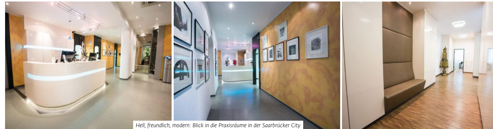
Hell, freundlich, modern: Blick in die Praxisräume in der Saarbrücker City

Gold, Silber, Amalgam: Viele Patienten haben gleich mehrere Metalle im Mund. Das kann mittelfristig zu Unverträglichkeiten und mithin zur Blutvergiftung führen. Viele Menschen sind auch chronisch müde, depressiv und leiden unter Neurodermitis, wissen jedoch gar nicht, dass dies womöglich auf die Metalle im Mund